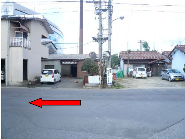
① ビジターサポーターの皆さんは左（西）へお進みください