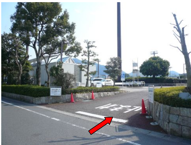
③ 「メイン自由席」「ピッチサイド席」のお客様はこちらか入場してください。