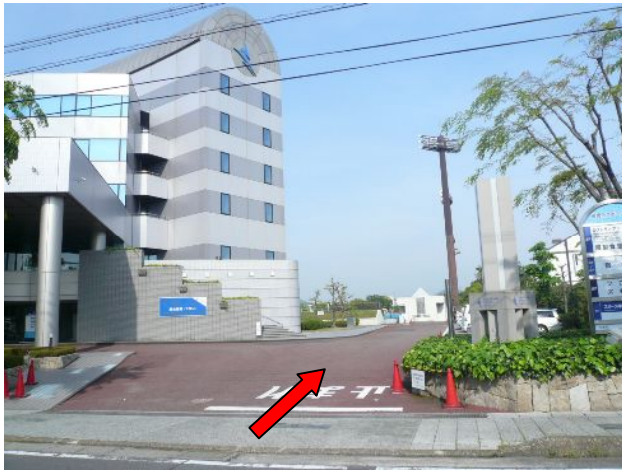
② 「バック・アウェイ自由席」でご観戦の皆さんはこちら(スポーツプラザ手前)から入場してください。