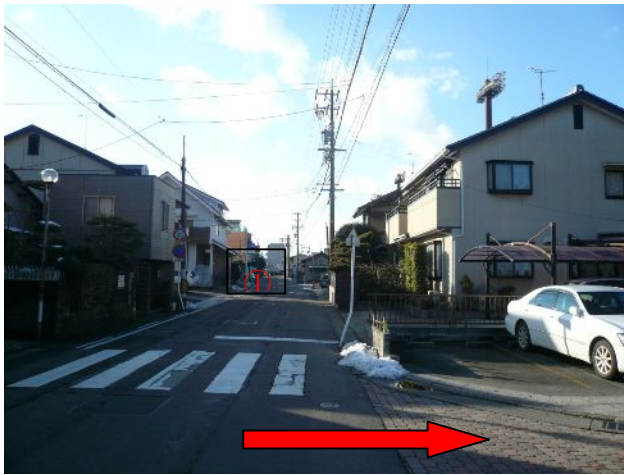
② 北方向へお進みください。