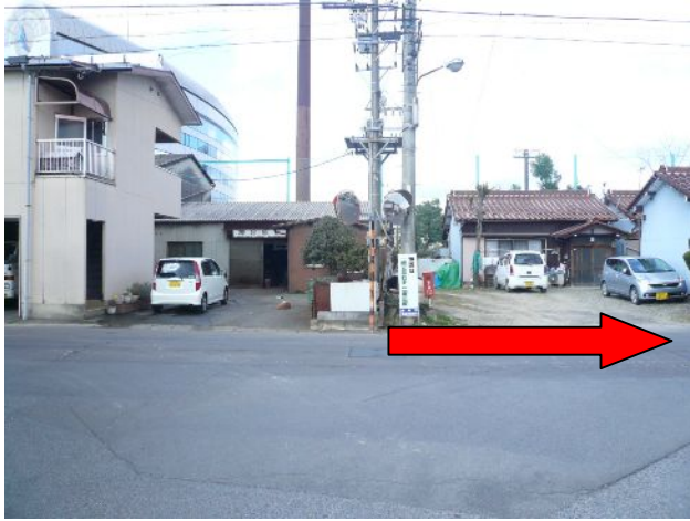
① ホームサポーターの皆さんは右（東）へお進みください