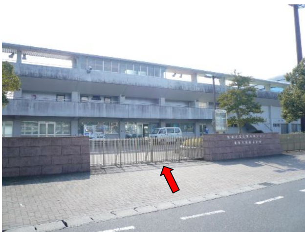
③ スタジアム入口です。