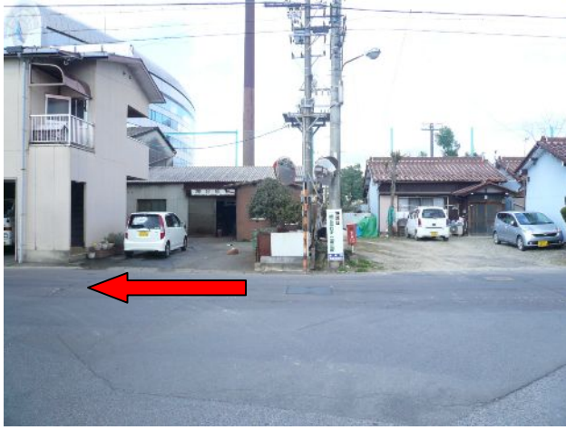
① ビジターサポーターの皆さんは左（西）へお進みください