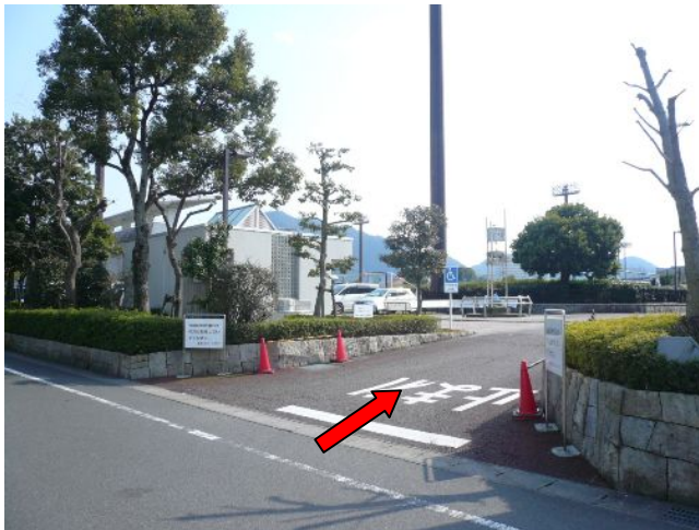
② スタジアム入口です。