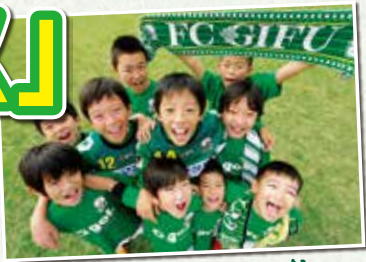
子どもたちに夢を!!

2014シーズンより、岐阜県内の小学生1年生～6年生の皆さんは、FC岐阜の公式戦ホームゲーム(プレーオフ、天皇杯は対象外)を 全試合無料 (バック自由席)で観戦できる「夢パス」を発行します。「夢パス」はホームゲーム会場にてお申込み受付、即時発行します。