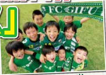
子どもたちに夢を!!

2014シーズンより、岐阜県内の小学生1年生～6年生の皆さんは、FC岐阜の公式戦ホームゲーム(プレーオフ、天皇杯は対象外)を 全試合無料 (バック自由席)で観戦できる「夢パス」を発行します。「夢パス」はホームゲーム会場にてお申込み受付、即時発行します。