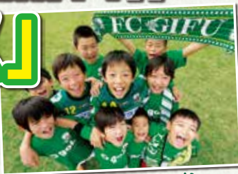
子どもたちに夢を!!

2014シーズンより、岐阜県内の小学生1年生～6年生の皆さんは、FC岐阜の公式戦ホームゲーム(プレーオフ、天皇杯は対象外)を 全試合無料 (バック自由席)で観戦できる「夢パス」を発行します。「夢パス」はホームゲーム会場にてお申込み受付、即時発行します。