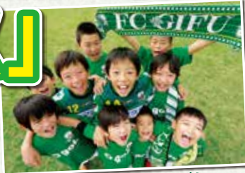
子どもたちに夢を!!

2014シーズンより、岐阜県内の小学生1年生～6年生の皆さんは、FC岐阜の公式戦ホームゲーム(プレーオフ、天皇杯は対象外)を 全試合無料 (バック自由席)で観戦できる「夢パス」を発行します。「夢パス」はホームゲーム会場にてお申込み受付、即時発行します。