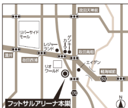
フットサルアリーナ本巣