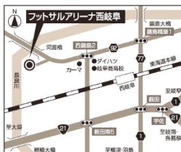
フットサルアリーナ西岐阜