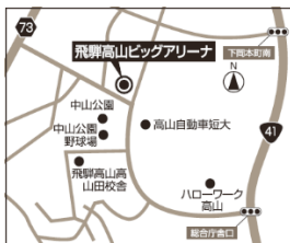
飛騨高山ビッグアリーナ